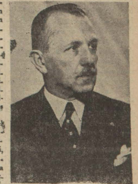
Cumhuriyet Halk Partisi Genel Başkan Vekili ve Başvekil Şükrü Saracoğlu

Cumhuriyet Halk Partisi genel merkezi tarafından teşkilâtı yapılan bir tamimde önümüzdeki aylarda sıra ile toplanacak olan parli, ocak, nahiye, kaza ve vilâyet kongrelerinde idare heyetlerine bilhassa aydın ve olgun Partili gençlerimizden ahlâk ve karakterine güvenebileceklerin seçilmeleri lüzumu üzerinde durulmuş ve onları Parti mekânizmasında yetiştirerek ileride yüklenecikleri ağır vatan vazifelerini şimdiden alıştırmak ve hazırlamak bakımından bu hareketin büyük önemi tebarüz ettirilmiştir.