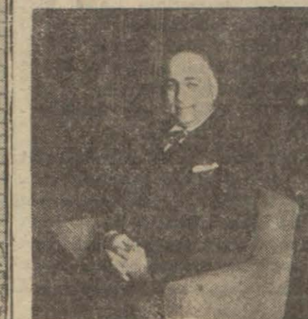
Adliye Vekili Hasan Menemencioğlu

Ankara 25 (Hususi) — Adliye Vekili Hasan Menemencioğlu, tetkiklerde bulunmak üzere İstanbula hareket etmiştir. Vekil, hareketinden evvel şu beyanatta bulunmuştur.